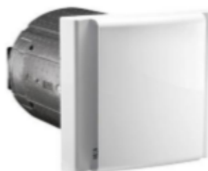
Wohnraumlüfter (Alternativ) Livento ALM-S mit Wärmerückgewinnung