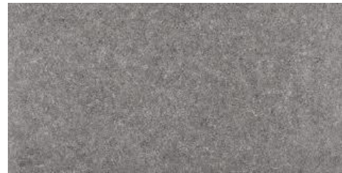
Bodenfliesen: Vitra Lombardy graubraun, Format 60/30 cm, rektifiziert, Rutschsicherheit: R10b