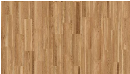
Bauwerk: Monopark Business Kurzstab, matt versiegelt