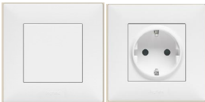
Schalterprogramm: Niloe, legrand