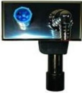
Waschgeräte-UP-Sifon mit integriertem Wasseranschluss