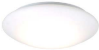
Deckenlampe: OL Series E27 IP44