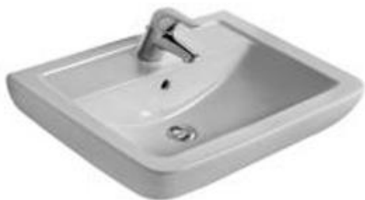
Waschtisch: Ideal Standard Eurovit 60 x 46 cm, Weiß