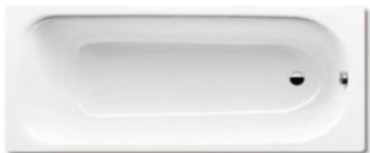
Badewanne: Saniform 373, Kaldewei 175 x 75 cm mit Schaumkörper, Stahlblech, Weiß