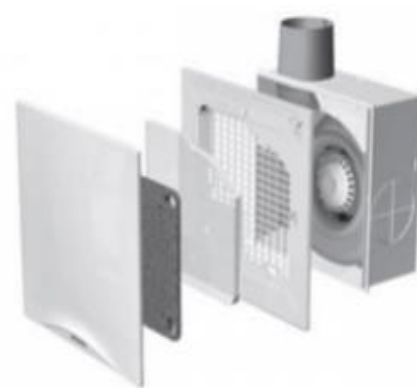
UP-Lüfter, Bad 2-stufig mit Feuchtefühler UP-WC mit Nachlaufrelais