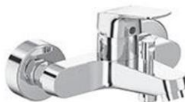
AP-Wannenarmatur: Ideal Standard, Ceraflex, Chrom