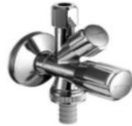
Doppelspindelventil für Küche mit GSP-Anschluss