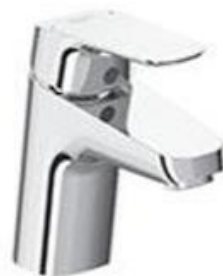
Waschtischarmatur mit Zugstange: Ideal Standard, Ceraflex