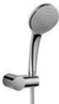
Handbrauseset: Ideal Standard mit 150 cm Schlauch