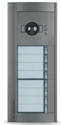
Außensprechstelle: Bticino Allstreet