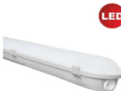
FR-Wannenleuchte: Eco LED