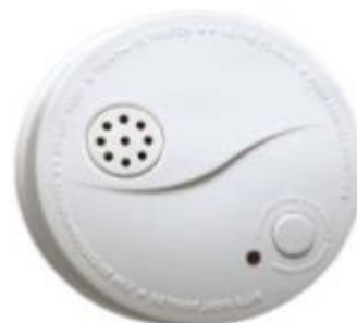
Rauchwarnmelder: RM Serie