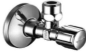
Eckventil für Waschtisch