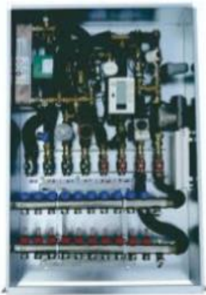
Wohnungsstation 100 x 65 x 12 mit integriertem FBH-Verteiler